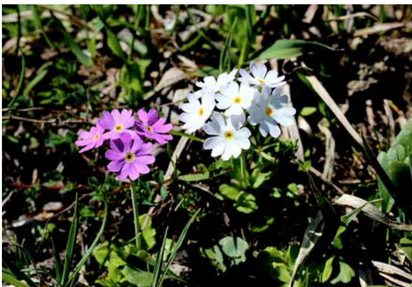
Einzigartig: Eine Mehlprimel in Weiss – ein solcher Albino wächst äusserst selten.