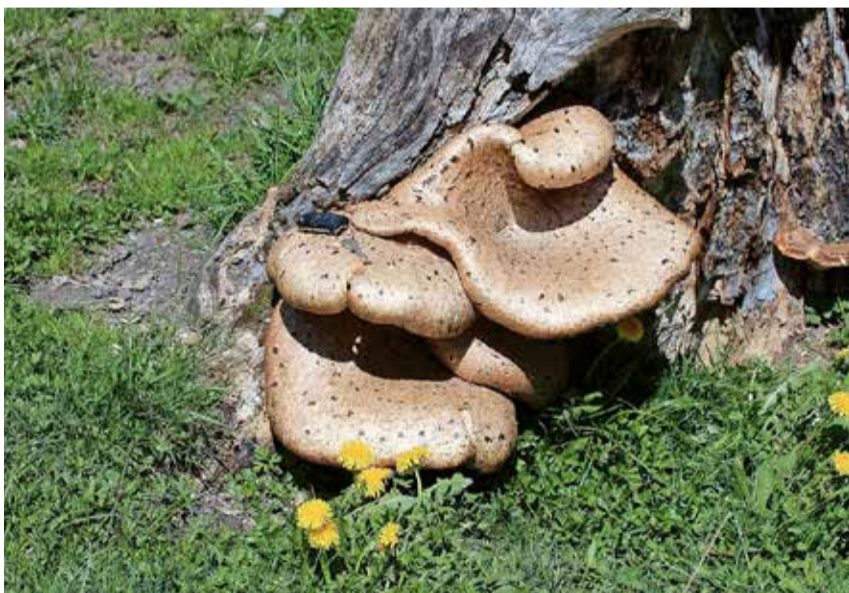
Rekordverdächtig: Ein in seinen Ausmassen gewaltiger Porling beteiligt sich an der Beseitigung eines faulenden Baumstamms.