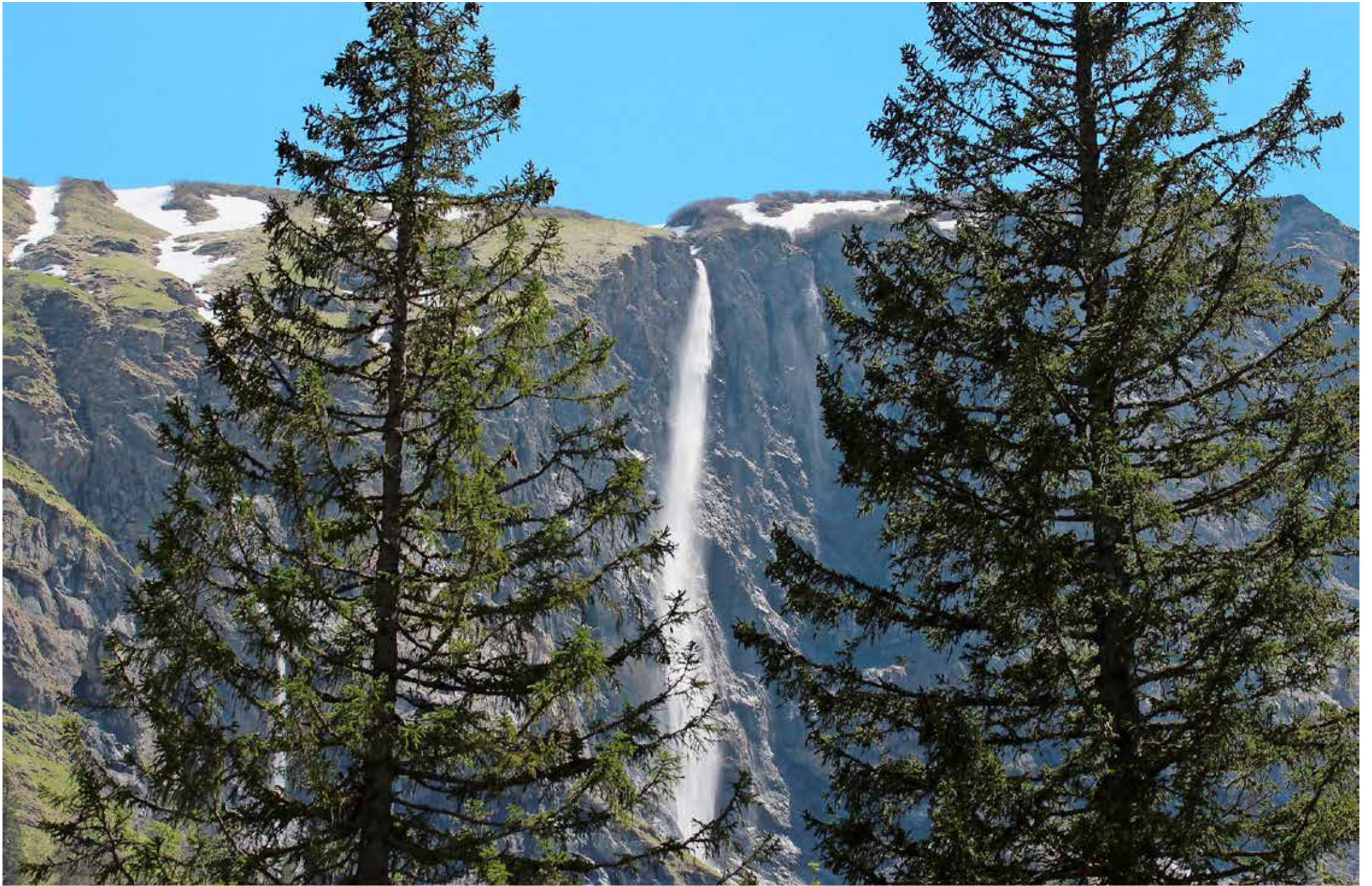
Imposant: Der Isegrindfall präsentiert sich in schönster Form zwischen den beiden Fichten als Nummer 3 der Schweiz: 230 Meter hoch.